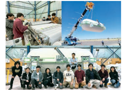
写真4：GRAINE計画・口径面積2.5m 2 の望遠鏡、2023年オーストラリアでのフライト準備。

一つ一つ問題を解決し、イタリアグラサンサツ研究所にて国際共同実験NEWSdmとして実験準備を進めている。検出器内部に混入したダストや放射性不純物の排除、プラズモニクスを用いた光学分解能以下の飛跡に対する超解像解析法、機械学習による事象識別等分野を超えた最先端技術を積極的に導入し、暗黒物質の検出を目指す。