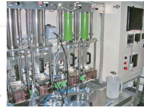
写真1：乳剤製造装置。世界でもここでしか原子核乾板の開発は出来ない。

准教授：2（特任含む）／講師：1（特任含む）／助教：4（特任含む）／研究員：3／DC：4／MC：11／4年：3