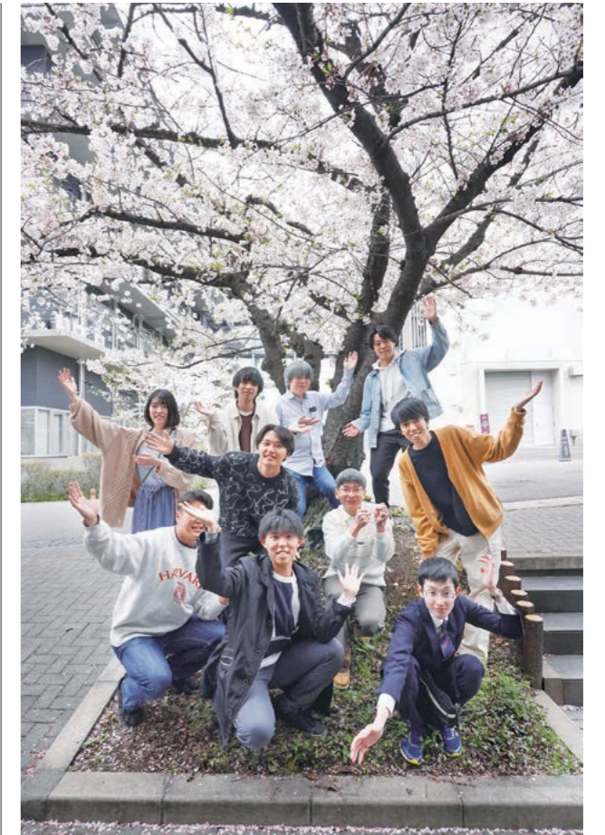
スタッフ, 大学院生と学部学生

私たちは、カエル神経筋接合部シナプスを用いて、神経伝達物質の放出機構そのものや、刺激依存的に引き起こされるシナプス前由来の伝達物質放出増大の短期可塑性等の放出量の調節機構の解明を目指して研究している。Ca 2+ 等の二価陽イオンがこれらの機構にどのように関与しているのかを、シナプス前末端内イオン動態イメージング法 (イオン結合性蛍光色素を用いて、細胞内イオン濃度変化を可視化する方法) や伝達物質放出量をモニターするための電気生理学的測定を通じて明らかにしておく。